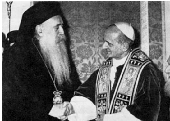
Patriarhul Athenagoras I și Papa Paul VI, la întâlnirea istorică de la Ierusalim, în 1964.

Deși alte organizații ecumenice folosesc date sau materiale diferite, ideile și practica provin din sursa citată mai sus.